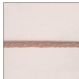
Cable 29 Hilos