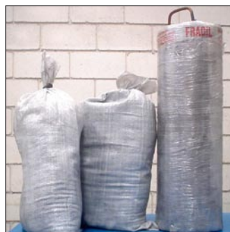
Electrodos de Carbon 20 X 60 centímetros Calibre 1/0