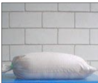
Bentonita Sodica Bulto de 50 Kgs.