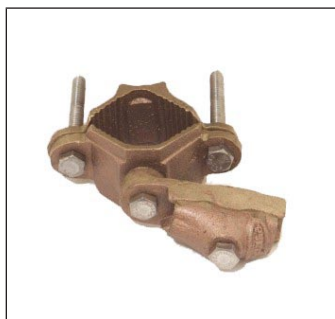
Conector de Tuberías 38 - 51 mm C-306-A