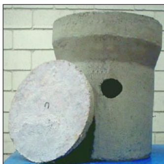
Tubo de Albañal con Tapa 12 pulg. Diametro X 60 cm altura