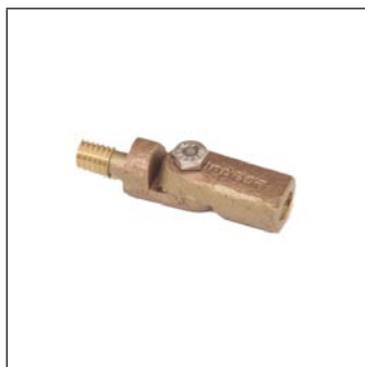
Rodilla Niveladora C-63-A