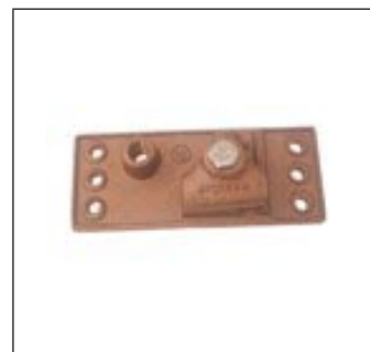
Base Plana Para Techo de Lámina Acanalada C-LA-100