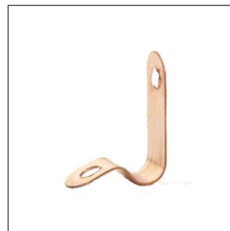
Abrazadera para Cable C-121-A