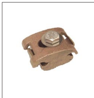
Abrazadera para Tierra C-297-A