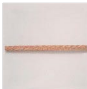
Cable 32 Hilos