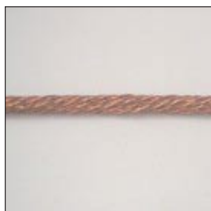
Cable 28 Hilos