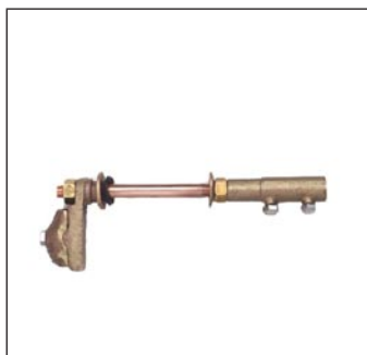
Pasa Losa C-597-R