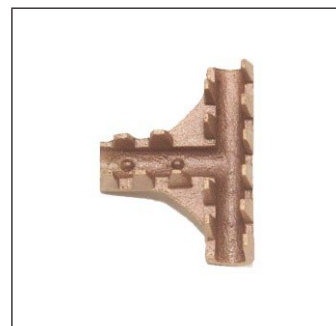
Conector "T" C-262