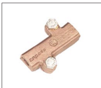
Conector Mecánico Recto C-305