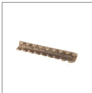
Conector Recto C-33-X