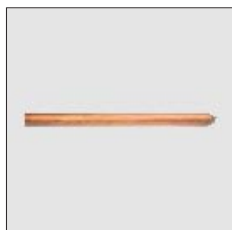
Varilla Cooperweld 5/8" Varilla Cooperweld 3/4"