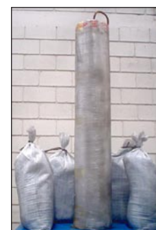
Electrodos de Carbon 20 X 120 centímetros Calibre 2/0