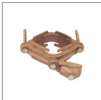
Conector de Tuberías 64 - 102 mm C-306-B