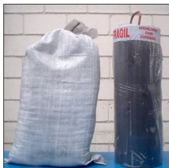
Electrodos de Carbon 15 X 45 centímetros Calibre 2