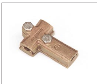
Conector Mecánico "T" C-304