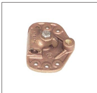
Base Plana para Punta Faraday C-60