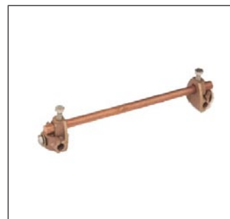
Pasa Muro C-272-X