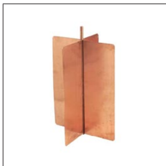
Rehilete de Cobre C-585