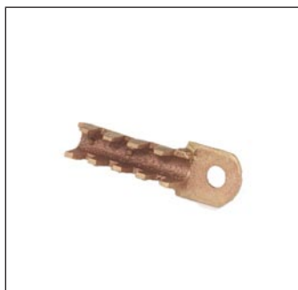
Conector Zapata C-5