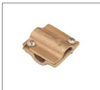
Conector Mecánico en "X" C-119