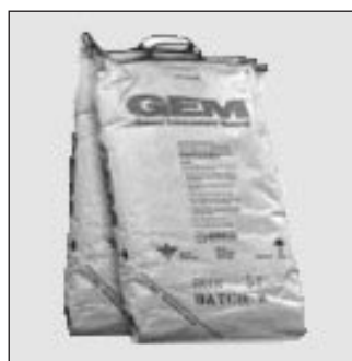
Gem (Intensificador de Tierra) Bulto de 25 libras