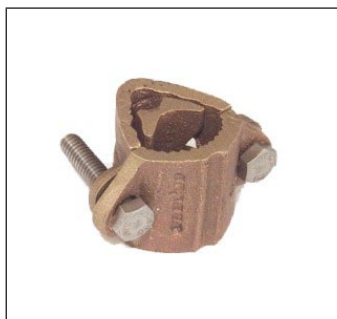
Conector de Tuberías 13 - 25 mm C-306