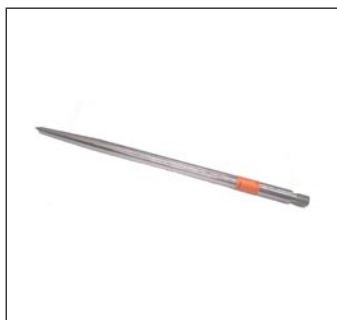
Puntas Faraday 30 cm Puntas Faraday 60 cm Puntas Faraday 90 cm Puntas Faraday 122 cm