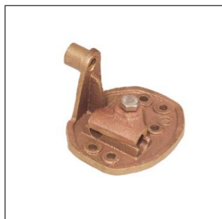
Base de Pretil para Punta Faraday C-274