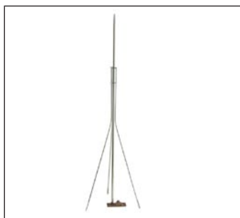
Tripe Galvanizado C-111 Tripe Galvanizado C-112