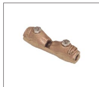
Desconector Mecánico para Bajada de Prueba C-303-X